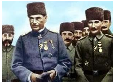
Ὁ Γερμανὸς στρατηγὸς Ὄθων Λίμαν Φὸν Σάντερς μετὰ τὸν Κεμάλ

«Ἀδειάστε τὴν Μικρὰ Ἀσία ἀπὸ τὰ ἰθαγενῆ στοιχεῖα ποὺ σᾶς στέκονται ἐμπόδιο, ἔλεγε ἐκεῖνο τὸν καιρὸ ἡ Πρωσικὴ κυβέρνησις στοὺς Ταλαὰτ καὶ Ἐμβέρ. Εἶμαστέ δάσκαλοι στὴν τέχνη τῆς ἐκκένωσης. Καὶ ἐμεῖς θὰ ἀντικαταστήσουμε τοὺς σκύλους τοὺς Ἕλληνες, τοὺς ταραχοποιούς καὶ ἄχρηστους μετὰ καλοὺς καὶ τίμιους Γερμανούς, ὑποταγμένους καὶ ὑπάκουους, οἱ ὁποῖοι θὰ σᾶς ἀποδώσουν στὸ ἑκατονταπλάσιο αὐτὸ ποὺ ἡ ἐξαφάνισις τῶν Ἑλλήνων θὰ σᾶς ἔχει στερῆσει. Καὶ τὰ ὀφελῆ ἀπὸ τὴν ἐπιχείρησις θὰ εἶναι γιὰ σᾶς σημαντικότερα ἀπὸ ὅ,τι ὅλοι οἱ θησαυροὶ τοῦ χαλίφη». Ἀπὸ τὸ βιβλίον «Berlin - Bagdad» τοῦ Gerhard Albert Pitter (1929-2015) ὅπως ἀποδίδεται στὸ βιβλίον «Τουρκία καὶ Ἀνατολικά ζητήματα» τοῦ Θεόδωρου Μπατρακούλη, ἐκδόσεις Ἰνφογνώμων σελίδα 321. Ἀπὸ τὴν ἐποχὴ τοῦ πρώτου