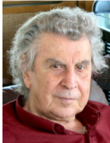
Ὁ κ. Μίκης Θεοδωράκης

Ὁ μόνος πὸν ἀπάντησε δημοσίως σ' αὐτὰ ἀπ' ὅ,τι γνωρίζω, είναι ὁ Κώστας Γεωργουσόπουλος σὲ τελευταῖο ἄρθρο του στὰ «ΝΕΑ» ὁ ὁποῖος πρὸς τιμὴν του ἀναφέρει: «Ἡ κ. Φραγκουδάκη θεωρεῖ πὸς κάθε ἀναφορά σὲ πατρίδα, πατριωτισμό, ἔθνος είναι συντηρητική, δεξιά και σχεδὸν φασιστική πολιτική. Ἔτσι καλὸ θὰ εἶναι νὰ ἀπαλειφθοῦν ἀπὸ τὰ σχολικά βιβλία ὅλα τὰ ποιήματα, τὰ διηγήματα και τὰ δοκίμια πὸν ἀναφέρουν θετικὸς χαρακτηρισμοῦς μας ὡς ἔννοιες «πατρίδα», «ἔθνος». Πρέπει εὐθὺς νὰ ἀφαιρεθοῦν ἀπὸ τὰ σχολικά ἔγχειρίδια ὅλες οἱ ἀναφορὲς πὸν ὑπάρχουν τοῦ Σολωμοῦ και ἰδίως στὸν πατριδοκαπηλικὸ «Ἕγμνο εἰς τὴν Ἐλευθερία» στίς ἔννοιες «πατρίδα» και «ἔθνος». Ἄν δὲν γίνεται νὰ καταχωνιαστεῖ ἡ «Ἱστορία τοῦ Ἑλληνικοῦ Ἔθνους» τοῦ Παπαρηγόπουλου, καλὸ θὰ εἶναι νὰ καεῖ. Ὅπως δῆποτε ὅμως θὰ πρέπει νὰ καεῖ και μάλιστα δημοσίως τὸ φασιστικὸ μυθιστόρημα τῆς Πηνελόπης Δέλτα «Γιὰ τὴν