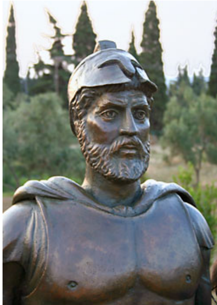
Ὁ ἥρωας τοῦ Μαραθῶνος Μιλτιάδης καὶ θῦμα τῶν πολιτικάντηδων

θὰ λάβουν οἰκονο- μικὴν βοήθειαν, θὰ ἀναπτυχθῆ τὸ ἐμπό- ριον κ.τ.λ. (Τί σὰς θυμίζουν αὐτὰ σή- μερα;). Ὁ Μιλτιά- δης καὶ οἱ συστρά- τηγοὶ τοῦ εἰσῆλθον στὴν Ἐκκλησίαν τοῦ Δήμου καὶ ὠ- μίλησαν στὸν λαὸν καὶ ἀφοῦ ἐξύμνη- σαν τὴν ἐθνικὴν ἐ- λευθερίαν τῆς Ἑλ- λάδας ἐκάλεσαν τοὺς Ἀθηναίους νὰ πολεμήσουν ἐνα- ντίον τῶν Περσῶν. Οἱ ἡττοπαθεῖς πο- λιτικοὶ προδότες ἀπεμονώθησαν καὶ