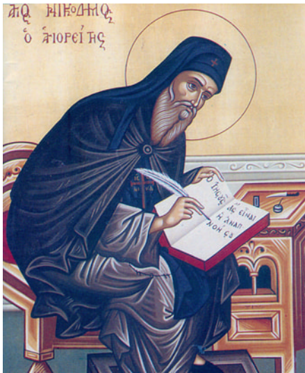
Ὁσιος Νικόδημος ὁ Ἄγιορείτης

πῆρες, ἀρκετὰ μὲ ταλαιπώρησες». Συγκλονισμένος τότε ἔτρεξε καὶ βρῆκε τὸν π. Σταῦρο Φραγγουλίδη τῆς Μητροπόλεως Ἐδέσσης, στὸν ὁποῖο ἐξομολογήθηκε μὲ λυγμοὺς καὶ δάκρυα, λέγοντας «ἀμάρτησα πάτερο, ἔγινα ἱερόσυλος» καὶ τοῦ παρέδωσε τὸ Ἱερὸ Λείψανο. Ὁ π. Σταῦρος, παρέλαβε τὸ Ἱερὸ Λείψανο τοῦ Ἁγίου καὶ συγκλονισμένος ἀμέσως τὸ ἐπῆγε στὴν Ἱερὰ Μονὴ τοῦ Ὁσίου Νικοδήμου. Ἀξίζει νὰ ση-