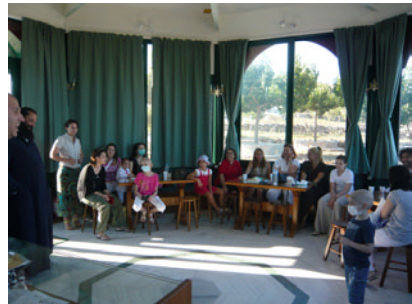
Ἀπὸ τὶς ἐπισκέψεις τῶν παιδιῶν τοῦ Συλλόγου ΕΛΠΙΔΑ στὸν Ἅγιο Ραφαήλ.

κατὰ βάσιν γιὰ τὸν ἑαυτὸ του. Στὸ Χριστιανισμὸ ὁ Θεὸς ἔχει τὸ Μεγαλεῖο τῆς Ἀγάπης καὶ νοιάζεται ἀποκλειστικὰ γιὰ τὸ δημιούργημά Του, γι' αὐτὸ καὶ γίνεται ἀνθρώπος καὶ θυσιάζεται γι' αὐτό. Γιὰ τὸν Χριστιανισμὸ, ὁ παράδεισος εἶναι αἰώνια πνευματικὴ εὐφροσύνη ποὺ προέρχεται ἀπὸ τὸ Μεγαλεῖο τῆς παρουσίας, θέασης καὶ βίωσης τοῦ Θεοῦ. Ἀντίθετα, γιὰ τὸ μουσουλμανισμὸ εἶναι ἡ αἰώνια ἀπόλαυση γήινων ἡδονῶν: ποταμοὶ ἀπὸ γάλα καὶ κρασί, ὄμορφες γυναῖκες κ.ἄ. Πρέπει λοιπὸν νὰ μείνουμε σταθεροὶ στὴν πίστη μας, ποὺ παραδόθηκε ἐξαρχῆς τέλεια ἀπὸ τὸν Κύριο καὶ Θεὸ μας Ἰησοῦ Χριστό, ποὺ εἶναι βεβαιωμένη μὲ ἄπειρα θαύματα, ποὺ ἀποτελεῖ τὴν πυξίδα στὴ ζωὴ μας, ἀλλὰ καὶ τὸν ἀκλόνητο βράχο στὸν Ὅποιο ὅποιος στηρίζεται δὲν καταποντίζεται ποτέ.