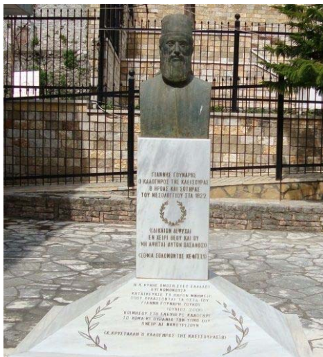
Ἡ Προτομὴ τοῦ ἥρωα Γιάννη Γούναρη

νὰ κάνουν φασαρία, γιὰ νὰ νομίσουν οἱ Τούρκοι ὅτι ὁ κόσμος γιορτάζει. Ὁκακόσοι Τουρκαλβανοὶ ἐπιτέθηκαν στὴν ἀνατολικὴ πλευρὰ τοῦ Μεσολογγίου καὶ βρῆκαν σθεναρὴ ἀντίσταση. Οἱ ἀπώλειες τῶν Μεσολογγιτῶν ἦταν ἐλάχιστες, ἐνῶ οἱ ἀπώλειες τῶν Τούρκων ξεπερνοῦσαν τὶς 500. Λίγες μέρες