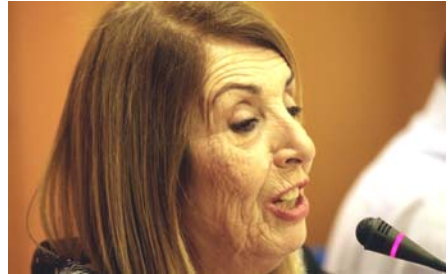
Ἡ κ. Τασία Χριστοδουλοπούλου

Ἡ Κυβέρνηση τοῦ ΣΥΡΙΖΑ ὑλοποίησε σταδιακὰ ἓνα σχέδιο ἐγκατάστασης στὴ χώρα μας τῶν παράνομων μεταναστῶν καὶ τῶν χιλιάδων προσφύγων, ἔχοντας ἀπὸ τὶς ἀρχὲς τοῦ 2015 ξεκινήσει τὶς σχετικὲς διεργασίες, γιὰ νὰ φτάσουμε στὸ σήμερα ποὺ καὶ ὁ καθ' ἕλην ἀρμοδίος ἀναπλ. ὑπουργός, Γιάννης Μουζάλας, παραδέχεται ὅτι ἡ Ἑλλάδα ἀπὸ χώρα transit μετατρέπεται σὲ χώρα ἐγκατάστασης. Πῶς συγκεκριμένα, τὸν Μάρτιο τοῦ 2015, διέρρηξε ἐγγράφο συνεργάτη τῆς τότε ἀναπληρώτριας ὑπουργοῦ Μεταναστευτικῆς Πολιτικῆς Τασίας Χριστοδουλοπούλου ποὺ οὐσιαστικὰ προέβλεπε νὰ ἀνοίξουν τὰ σύνορα! Διότι, δύο κυρίες -σετέλεχ τῆς Ἐπιτροπῆς Δικαιωμάτων τοῦ ΣΥΡΙΖΑ- εἶχαν ἐγκατασταθεῖ στὸ ὑπουργεῖο Προστασίας τοῦ Πολίτη καὶ -στὸ ὄνομα τῆς κ. Χριστοδουλοπούλου- ὑπαγόρευ-