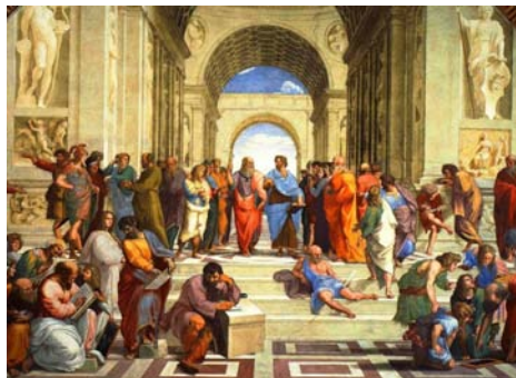
Ἡ Ἀκαδημία τοῦ Πλάτωνος μὲ τοὺς ἑξαιρετικοὺς μαθητὰς τῆς

σες καὶ Ἀραβες ἕναν ἀνεξάντλητον θησαυρὸν γνώσεως καὶ ἔγινε ἡ Βαγδάτι ἡ «Ἀθήνα τῆς Ἀνατολῆς». Τὰ ἔργα τῶν Ἑλλήνων σοφῶν συνέφεραν στὴν Βαγδάτι κατὰ χιλιάδες καὶ ὁ χαλίφης Ἄλ-Μαμουὺν πλήρωσε ὑπέρογκα ποσὰ στοὺς μεταφραστὰς τοῦ γιὰ νὰ ἐπισπεύσουν τὶς μεταφράσεις στὴν ἀραβικὴν γλῶσσαν. Τὸ 823 μ.Χ. ὁ στρατὸς τοῦ χαλίφης τῆς Βαγδάτης Ἄλ Μαμουὺν συγκρούεται μὲ τὸν στρατὸν τοῦ Βυζαντινοῦ Μιχαὴλ Β΄ στὴν Μικρὰ Ἀσία καὶ νικᾷ. Γιὰ νὰ ὑπογράψῃ σύμφωνον εἰρήνης καὶ ἐπιστροφῆς τῶν Ἑλλήνων αἰχμαλώτων ἀπαιτεῖ ὁ Ἄλ Μαμουὺν ἕναν πρωτοφανῆ ὄρο στὴν στρατιωτικὴν ἱστορία. Νὰ τοῦ παραδοθοῦν ἀντί-